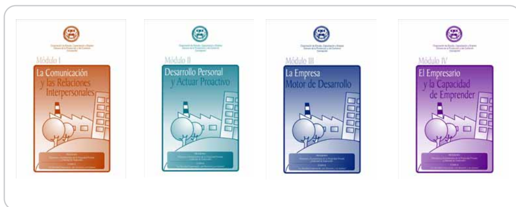
Módulos del Programa Principios y Fundamentos de la Propiedad Privada y Libertad de Emprender.