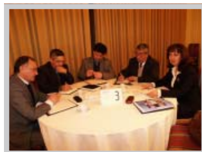
Trabajo grupal de participantes