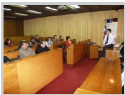
Curso Norma de Calidad