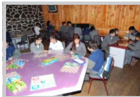
Sala de Juegos en el Liceo Industrial Fundación F.W. Schwager