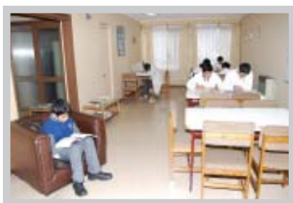
Sala de estudio, internado de Tomé

Cuarenta jóvenes de los sectores rurales de Tomé se acogieron gratuitamente en el Internado del Liceo Industrial de esta ciudad, para el cual la Corporación de Estudio cubrió el financiamiento de sus consumos básicos, mantención, personal de apoyo, calefacción y otros servicios del internado durante el año 2007.