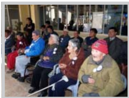
Abuelitos del Hogar de Ancianos San José de Tomé

Un significativo aporte en alimentos e insumos de uso personal realizaron los alumnos de los cinco liceos de la Corporación de Estudio al Hogar de Ancianos "San José" de Tomé, acción que se efectuó con motivo del mes de la solidaridad y dentro de las actividades de celebración de los 20 años de la institución.