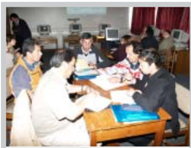
Trabajo grupal Sector Artes