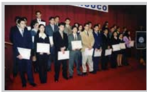
Jóvenes del Liceo Comercial Enrique Oyarzún Mondaca, INSUCO, en ceremonia de Titulación y Certificación de Aptitud Profesional

Desde la puesta en marcha del programa se ha certificado a 7.711 egresados.