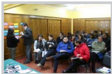
Taller realizado en Los Angeles