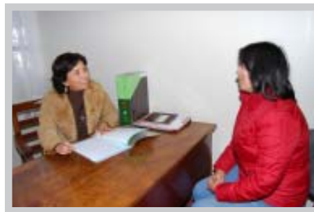
Sala de atención a apoderados