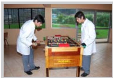
Sala de Juegos en el Liceo Industrial de Tomé