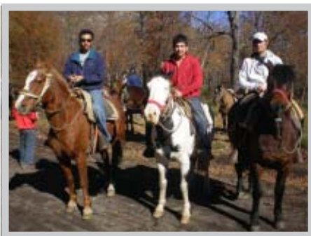
Alumnos disfrutando del paseo en Valle las Trancas

Al igual que todos los años, la ceremonia de clausura de los megaeventos contó con la alegre presentación del grupo de Bastoneras perteneciente a la Corporación de Estudio.