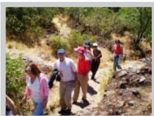
Paseo de fin de año, recinto Las Mellizas