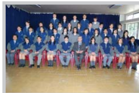
Liceo Comercial Enrique Oyarzún Mondaca