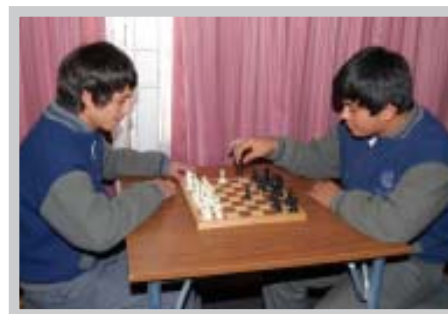
Sala de Juegos en el Liceo Industrial de Concepción