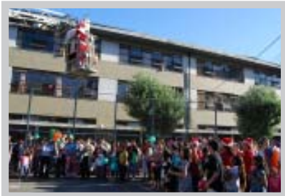
Viejo Pascuero llegando

Se fortaleció el espíritu institucional por medio de múltiples actividades, entre las que destacamos la convivencia de fin de año, en que el personal de todas las unidades se reunió en el Liceo Industrial de Tomé que oficia de anfitrión recibiendo a la comunidad laboral y brindándoles sus atenciones.