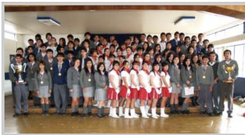
Alumnos premiados Megaevento 2007