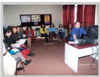
Trabajo grupal Sector Inglés