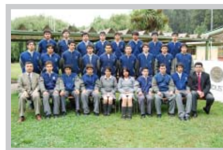
Liceo Industrial de Concepción