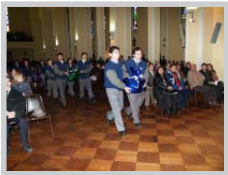
Alumnos entregando ofrenda

En la Iglesia Catedral de Concepción, en junio, se ofició una misa conmemorativa y de acción de gracias. En ella participaron autoridades e integrantes de la comunidad corporativa, así como familiares de socios, de trabajadores y de estudiantes fallecidos a lo largo de estos 20 años, uniéndose todos en una emotiva actividad espiritual.