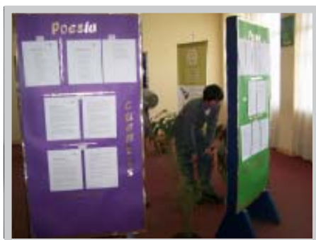
Muestra itinerante de las disciplinas ganadoras

Con motivo del 20º Aniversario de la Corporación de Estudio, se realizó el concurso de cuento, pintura y poesía, dirigido a todos los alumnos cuya temática fue "Mundo Estudiantil en los 20 Años de la Corporación de Estudio".