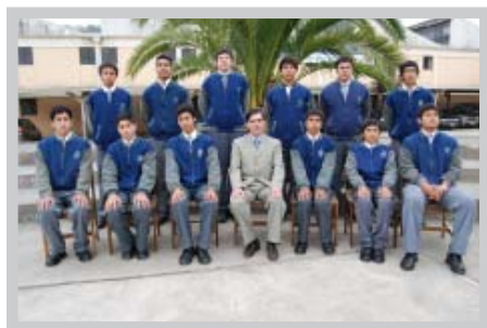
Liceo Insutrial de Tomé

El Cuadro de Honor lució en un lugar destacado del liceo.