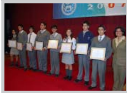
Alumnos que recibieron reconocimiento especial en ceremonia de certificación

Con el objetivo de que los alumnos de la Corporación reciban una atención personalizada y de la más alta calidad en la enseñanza del Inglés, desde 1997 funciona el laboratorio AngloLab, al cual asisten los alumnos de los cinco liceos corporativos.