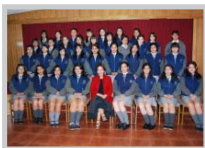
Liceo Comercial Femenino de Concepción