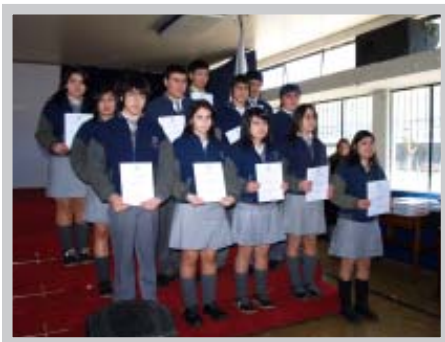
Entrega de certificados a alumnos que participaron en el programa, en acto de celebración del Día de la Educación Técnico Profesional

El estímulo a la iniciativa emprendedora constituye una de las principales orientaciones que entrega la Corporación de Estudio a sus alumnos, para lo cual se cumplió un nuevo período del programa Principios y Fundamentos de la Propiedad Privada y Libertad de Emprender. Participaron en este programa todos los estudiantes de los cinco liceos corporativos, con quienes se desarrollaron diferentes temáticas en períodos variables, según el programa correspondiente a cada nivel. Para ello se aplicó metodología que incluyó investigación, exposiciones orales y clases dirigidas así como módulos de autoinstrucción en clases guiadas por ingenieros comerciales, ingenieros civiles industriales y contadores auditores. En su última etapa, se realizaron diálogos, mesas redondas y foros con empresarios, los que se extendieron a todos los alumnos de cuartos años a través de sus docentes monitores.