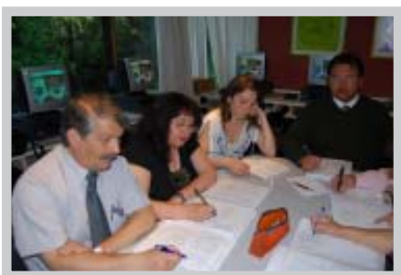
Curso de Capacitación de Inglés en AngloLab