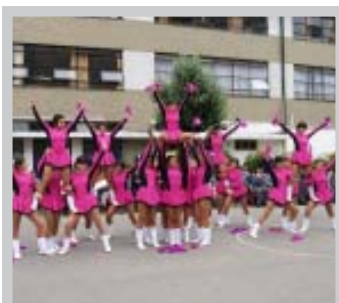
Presentación del grupo de Bastoneras