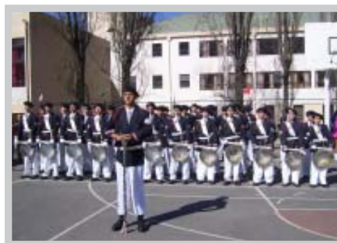
Banda de Guerra del Liceo Industrial de Tomé, que también recibió reconocimiento