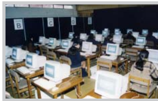
Proceso de postulación a primeros años 2007

La postulación a los primeros años de los liceos corporativos, se realiza por medio de un sistema totalmente computarizado. Estos recursos permiten una atención expedita y eficiente de los postulantes. Esto, considerando el alto número de jóvenes que cada año postulan a los liceos corporativos y que obliga a una selección lo más objetiva posible considerando la cifra limitada para primer año.