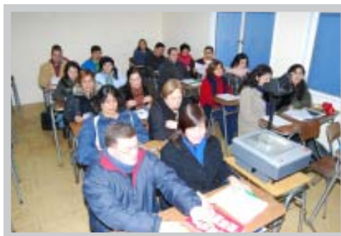
Alumnos del Programa de Nivelación de Estudios ChileCalifica

El servicio educativo tendrá una duración de cinco meses, comenzando las clases el 06 de marzo de 2008.