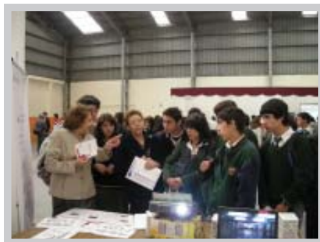
Red de Administración con alumnos de enseñanza media

Estudios sobre oferta y demanda de educación a nivel regional, además de desarrollar una asesoría con una empresa francesa, para la elaboración de itinerarios de formación técnica para el área de administración han sido las principales líneas de acción desarrolladas por la Red de Administración y Comercio de la Octava Región del Bío Bío, durante el 2007.