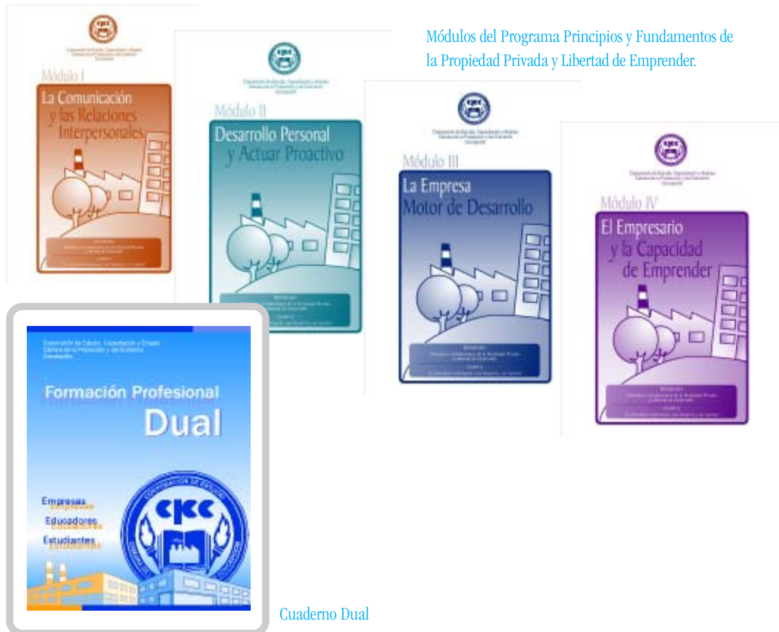
Módulos del Programa Principios y Fundamentos de la Propiedad Privada y Libertad de Emprender.

El material didáctico corresponde a materiales del plan general y del plan diferenciado, a las diversas actividades extraescolares, al programa de formación dual y a los programas de innovación educativa. Se incluye la edición de los módulos individuales para el programa Principios y Fundamentos de la Propiedad Privada y Libertad de Emprender, que se entregan gratuitamente a cada alumno; así como también, los cuadernos individuales de actividades del programa de formación profesional dual para más de dos mil alumnos.