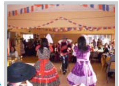
Celebración de Fiestas Patrias

En torno a comidas típicas, colores tradicionales y juegos folclóricos se realizó la convivencia de todo el personal, que se une en fiestas patrias bajo los auspicios de la Corporación de Estudio. Fue antitrión del encuentro, el Liceo Industrial de Tomé, que ofreció un espectáculo folclórico, juegos tradicionales y un concurso de cueca, realzando valores de la chilenidad y brindando una amena tarde a todos los asistentes.