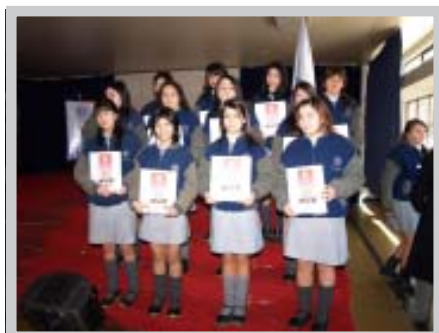
Inicio 21° Curso de Secretarías

Diversas oportunidades de formación recibieron 24 alumnas seleccionadas de cuarto año medio de la especialidad de secretariado de los Liceos Comerciales INSUCO e INCOFE.