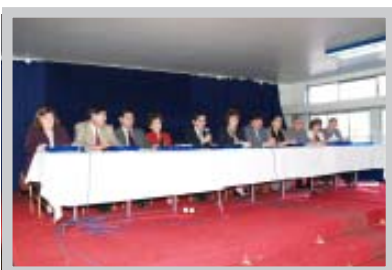
Inauguración con Directores Académicos y Jefes de UTP