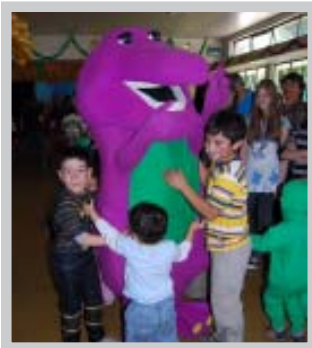
Niños con Barney

Con una celebración conjunta se realizó la Fiesta de Navidad organizada para los hijos de todos los trabajadores de la Corporación de Estudio y en la cual los niños pudieron disfrutar con payasos, concursos y muchos dulces. Además de la visita de Barney para los más pequeños.