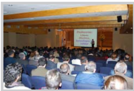
Docentes en seminario "Calidad de la Educación: Reflexiones desde el Aula"

De estas consultas se obtuvieron distintas apreciaciones que fortalecieron las ideas planteadas verbalmente por ellos, siendo uno de los resultados concretos, la habilitación en cada uno de los liceos corporativos de una sala destinada exclusivamente a la atención de los apoderados, optimizando en forma sustantiva las condiciones en las cuales se les recibe, además de otra sala para recibir a los estudiantes que llegan atrasados.