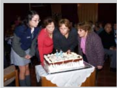
Celebración de Aniversario, Liceo Comercial INCOFE

La celebración de los aniversarios de cada liceo contó con la tradicional adhesión de la Corporación de Estudio, que participó activamente en los actos conmemorativos. Como todos los años, se entregó un obsequio destinado al bienestar del personal con este motivo, y se ofreció la cena de celebración a todos los trabajadores de cada establecimiento, en su oportunidad.