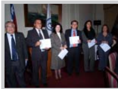
Premiación personal categoría excelente