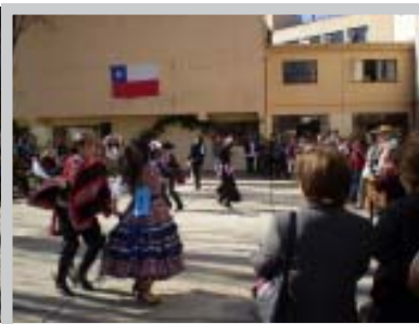
Celebración de Fiestas Patrias

En torno a comidas típicas, colores tradicionales y juegos folclóricos se realizó la convivencia de todo el personal, que se une en fiestas patrias bajo los auspicios de la Corporación de Estudio. Fue antitrión del encuentro, el Liceo Industrial de Tomé, que ofreció un espectáculo folclórico, juegos tradicionales y un concurso de cueca, realzando valores de la chilenidad y brindando una amena tarde a todos los asistentes.