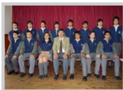
Liceo Industrial Fundación F.W. Schwager