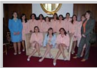
Celebración Día de la Secretaria

El Día del Profesor, en el mes de octubre, reunió a todo el personal en un almuerzo y tarde recreativa en el Casino Alemán, de Bulnes. Como ha sido costumbre a lo largo de los 20 años de la Corporación de Estudio, esta fecha permite expresar la adhesión de los ejecutivos y trabajadores en reconocimiento a la labor de los docentes.