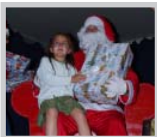
Los niños esperaron con entusiasmo sus regalos

La visita del Viejo Pascuero fue uno de los momentos más esperados por los niños, ocasión en la que recibieron un lindo obsequio.