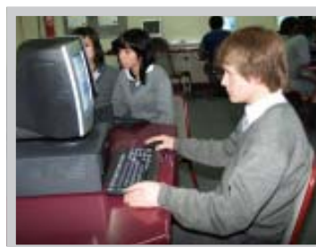
Laboratorios de Computación