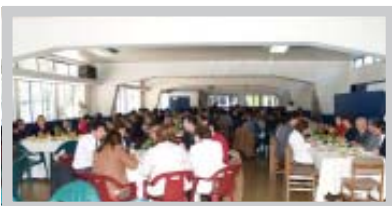
Vista general almuerzo