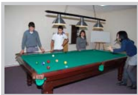
Sala de Juegos en el Liceo Comercial Enrique Oyarzún Mondaca, INSUCO

Las salas de juegos se caracterizan por contar con un ambiente acogedor y la mayoría de ellas cuentan con una mesa de pool, que complementa a los ya tradicionales taca-taca, mesa de ping pong, videojuegos, juegos de salón como ajedrez, dama, ludo y otros.