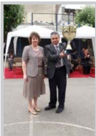
Entrega de "Copa 20 Años Corporación de Estudio" al Director Académico del Liceo Comercial INSUCO.

Durante el 2007, cerca de 3 mil estudiantes de los liceos de la Corporación participaron en los tres megaeventos realizados en el Parque Deportivo y Recreativo perteneciente al Liceo Industrial de Tomé, donde los jóvenes compitieron por la "Copa 20 Años Corporación de Estudio", en actividades deportivas como babyfútbol, básquetbol, ping pong, tenis y salto largo; recreativas como ajedrez y festival de intérpretes; y culturales, entre ellas, resolver acertijos y periodismo. En cada uno de estos eventos estuvieron presentes la Banda del Liceo Industrial de Tomé y el Equipo de Bastoneras de la Corporación de Estudio.