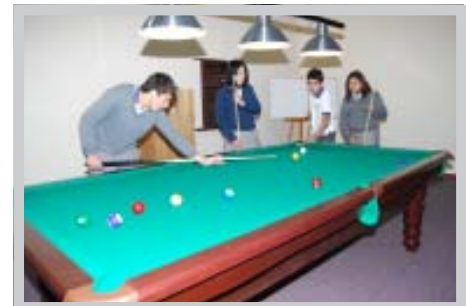
Sala de juegos