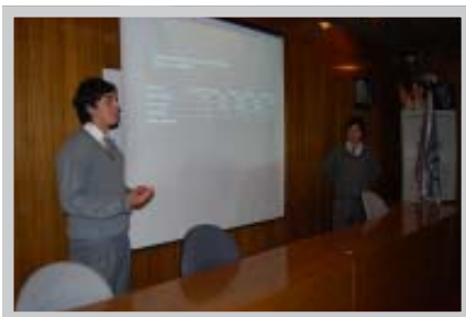
Alumnos exponiendo en el C.E.FE.

Alumnos de cuartos años de los cinco liceos corporativos, participaron en esta instancia, creada con la finalidad de desarrollar en sus alumnos la capacidad de emprender, crear e imaginar, asumir riesgos y tomar decisiones. Paralelamente, se entregaron los fundamentos éticos del crecimiento en comunidad, de los negocios y de la empresa.