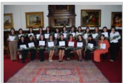
Certificación 21° Curso de Secretarías en el Club Concepción