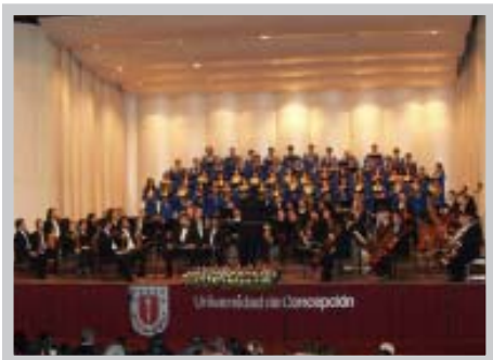
Vista general del Coro y Orquesta de la Universidad de Concepción

En el ofertorio alumnos representantes de los cinco liceos entregaron un canasto como inicio de la campaña solidaria. Esa misma tarde acudieron al hogar de ancianos San José de Tomé a oficializar su campaña.