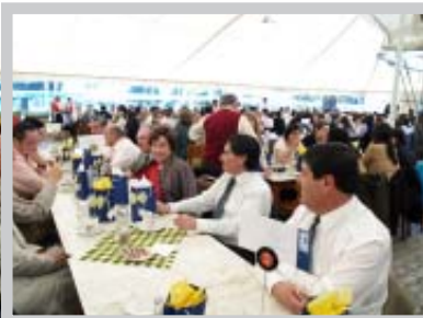
Celebración del Día del Profesor

Como formas de realzar los valores humanos y profesionales de sus trabajadores, se celebró como todos los años, dos fechas tradicionales.